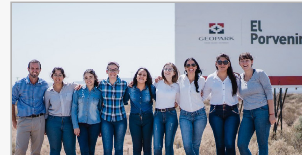
Visita de Becarias a las operaciones de GeoPark en Neuquén (Marzo 2020)